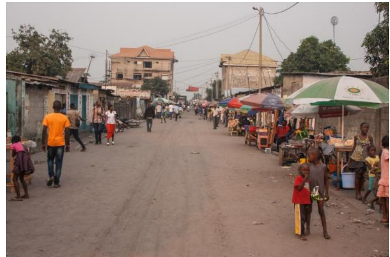
APRES LES TRAVAUX

A Kinshasa, EGMF reconstruit l'Avenue Kulumba, un axe important à Masina.