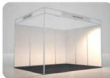
Type de stand modulable selon l'espace choisit